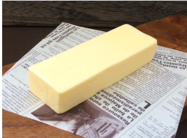
ファームズ千代田