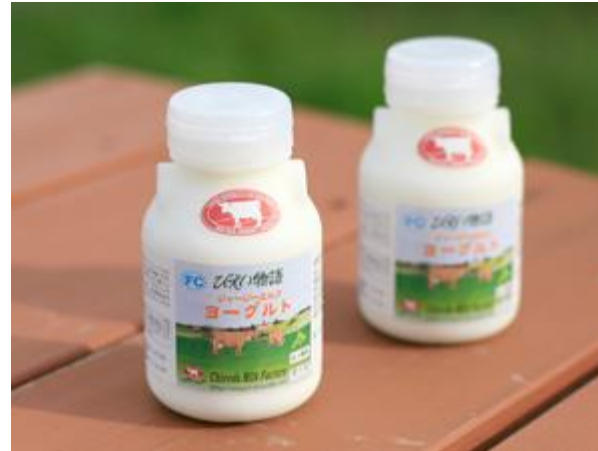
ファームズ千代田

希少な「ジャージー牛乳」から作られた濃厚なバターは、パンに塗って召し上がるのはもちろん、パンやお菓子づくりにもおすすめ。表面のこぼこ感が、手作りの証です。